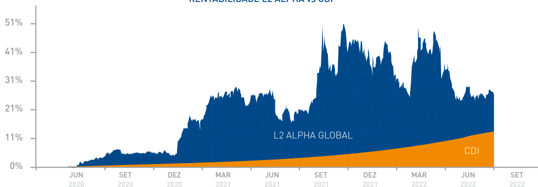
RENTABILIDADE L2 ALPHA vs CDI